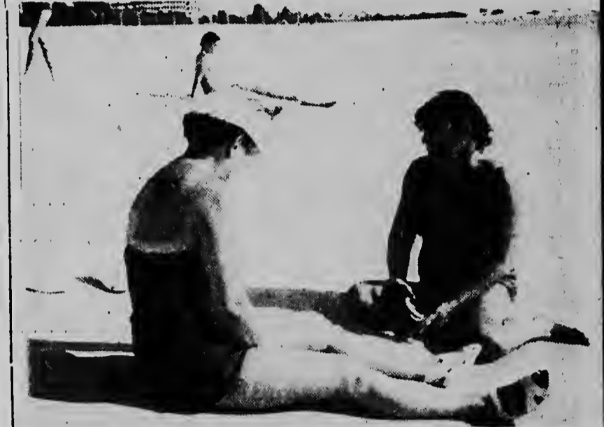
Cada hende ta goza na su manera: e damanan aki ta sinta sabroso cantu di Dushi cada biaha un poco awa ta pasa bato di bo.....